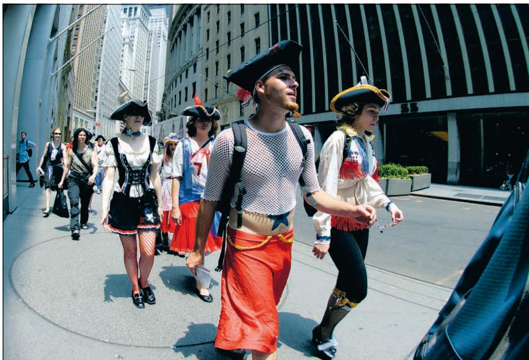
Le groupe Greene Dragon dans les rues de New York. La Convention républicaine doit être précédée d'une grande manifestation de ses opposants ; les Greene Dragon prévoient de rejouer la chevauchée de Paul Revere, qui annonça à la ville, en 1775, l'arrivée de l'ennemi.